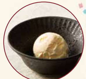
バニラアイス 190 (税込209)