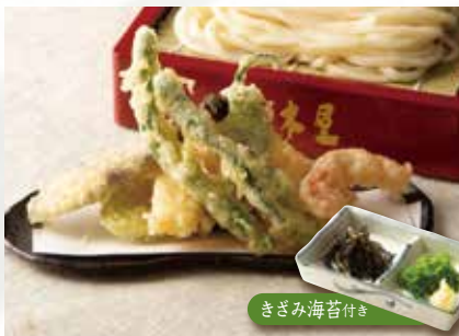
野菜の天ぷら 1,090 (税込1,199) 写真はイメージです。内容は係の者にお尋ねください。