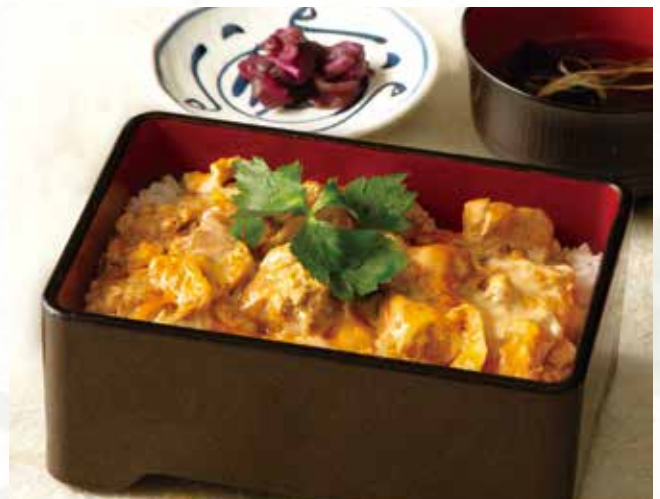
親子重 890 (税込979)