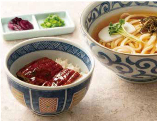
うどんと小鰻丼セット 1,790 (税込1,969)