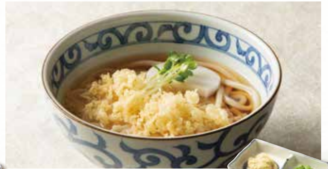
たぬき 790 (税込864)