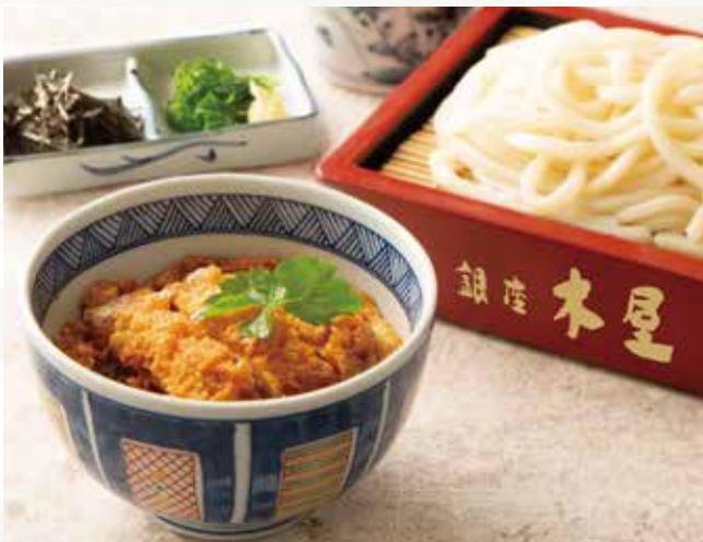
うどんと小かつ丼セット 1,290 (税込1,419)