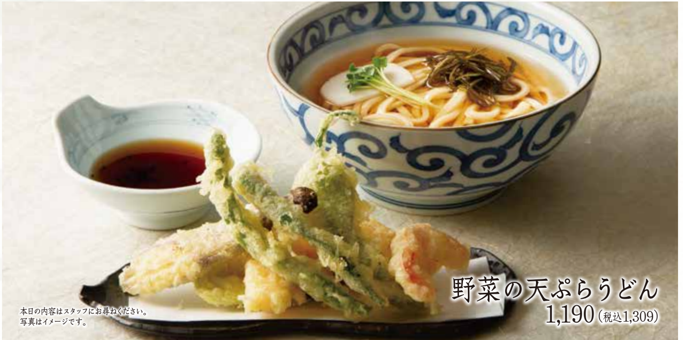
野菜の天ぷらうどん 1,190 (税込1,309)