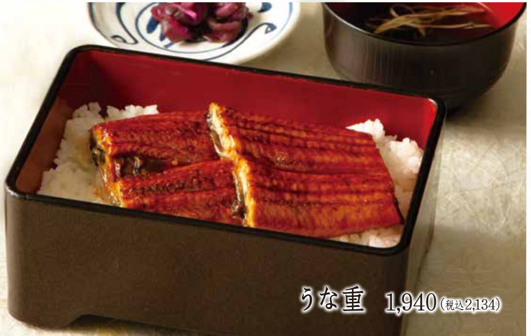
うな重 1,940 (税込2,134)