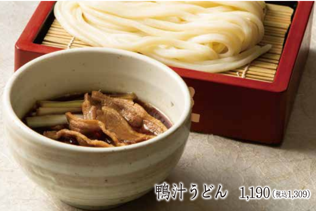
鴨汁うどん 1,190 (税込1,309)