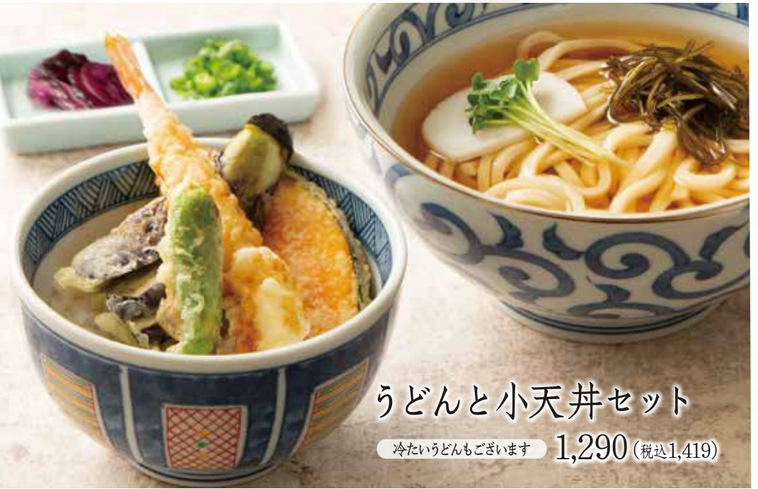
うどんと小天井セット