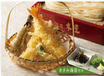
天せいろ 1,190 (税込1,309) 海老2尾・なす・かぼちゃ・ししとう