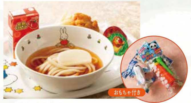
お子さまうどん 690 (税込759) 唐揚げ・ポテトフライ・りんごジュース・ゼリー