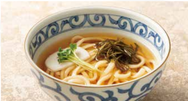
かけ 690 (税込759)