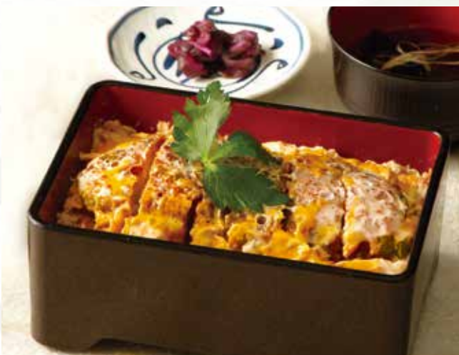
かつ重 990 (税込1,089)