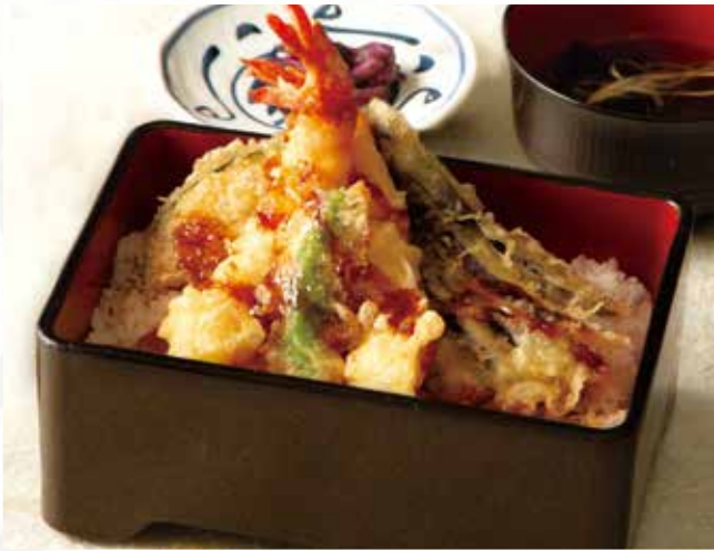
天重 990 (税込1,089)