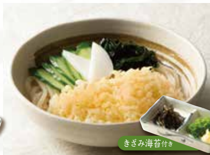
冷やしたぬき 890 (税込979)