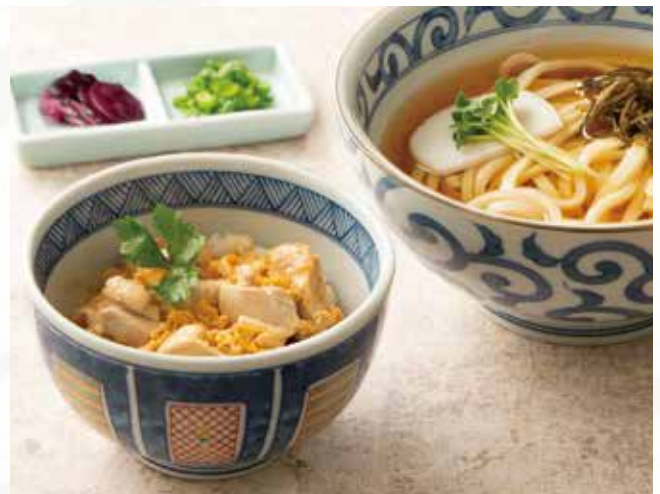
うどんと小親子丼セット 1,190 (税込1,309)