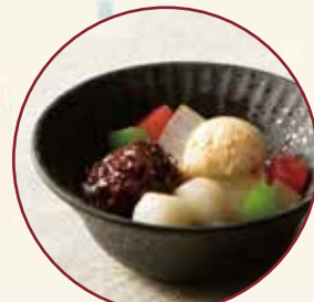
あんみつ 440 (税込484)