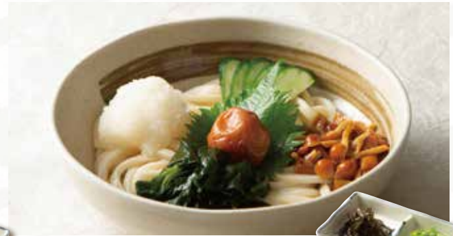
梅おろし 1,040 (税込1,144) きざみ海苔付き