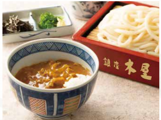
うどんと小カレー丼セット 1,190 (税込1,309)