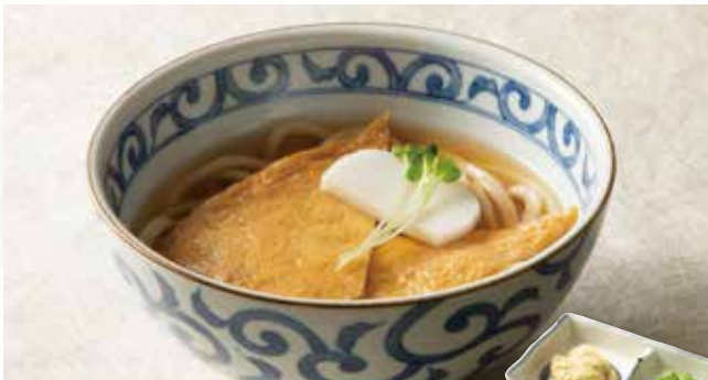
きつね 790 (税込869)