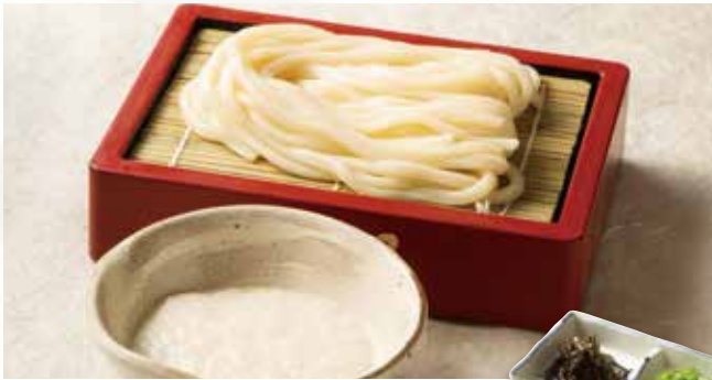
冷やしとろろ 990 (税込1,089) きざみ海苔付き