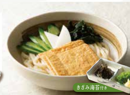
冷やしきつね 890 (税込979)