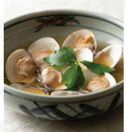
はまぐりの酒蒸し 1,300円