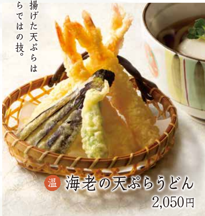
温 海老の天ぷらうどん 2,050円