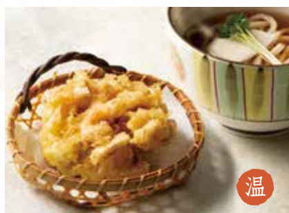
温 貝柱のかき揚げ 1,750円