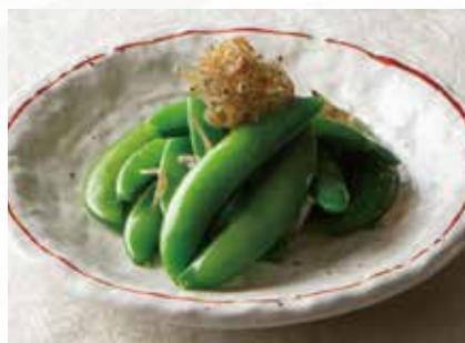
スナップエンドウのじゃこ炒め 1,000円