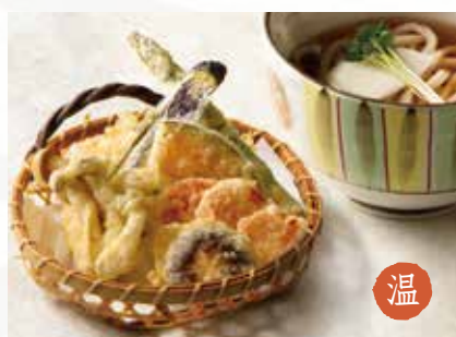
温 野菜の天ぷら 1,700円