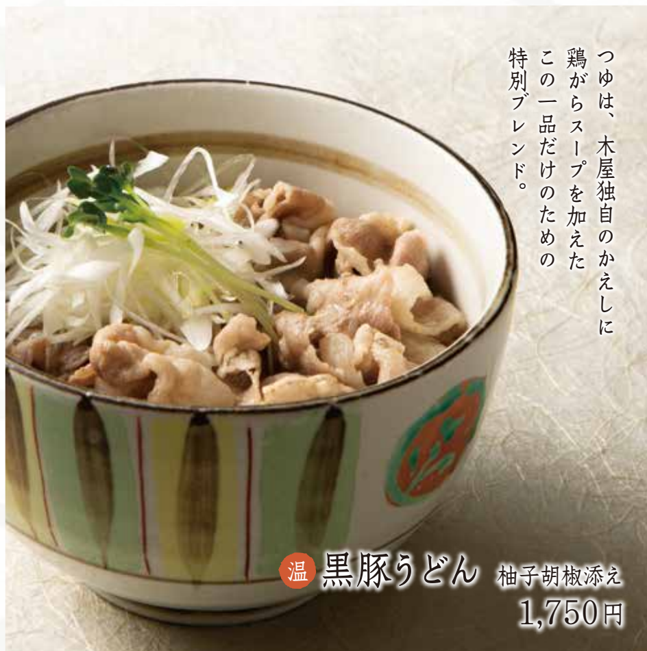
温 黒豚うどん 柚子胡椒添え 1,750円

つゆは、木屋独自のかえしに 鶏からスープを加えた この一品だけのための 特別ブレンド。