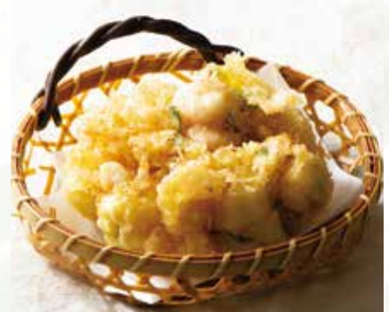
貝柱のかき揚げ 1,500円