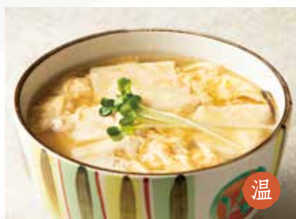
温 生湯葉玉子とじ 1,700円