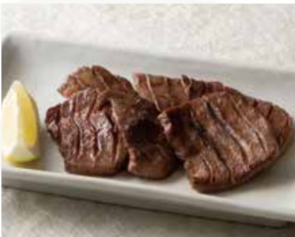
厚切り牛たん焼き 2,000円