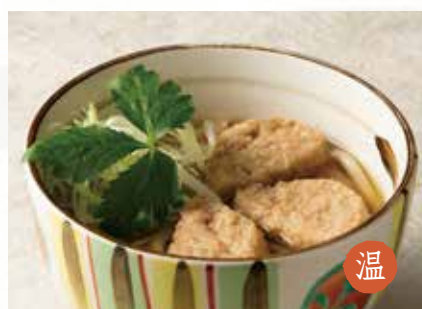
温 鶏のつくね 1,400円