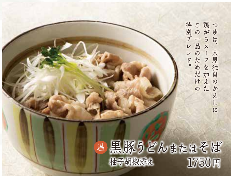
温 黒豚うどんまたはそば 柚子胡椒添え 1750円

つゆは、木屋独自のかえしに 鶏からスープを加えた この一品のためだけの 特別ブレンド。