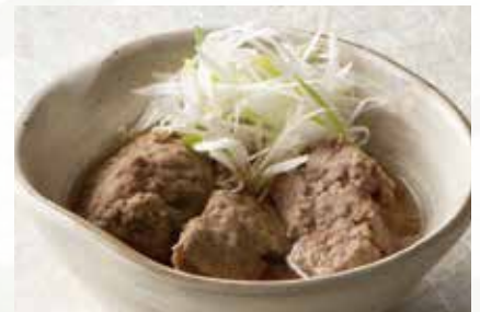
自家製 いわしつみれ煮 1,000円