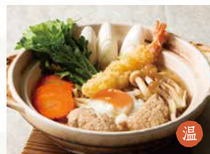
温 鍋焼きうどん 2,150円