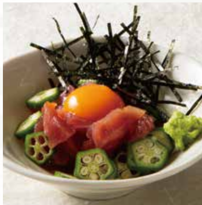
木屋風まぐろのユッケ 1,200円