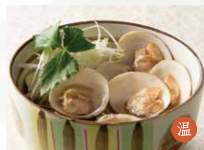
温 はまぐり 1,700円