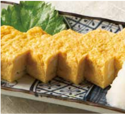
うどん屋の自家製厚焼き玉子 1,000円