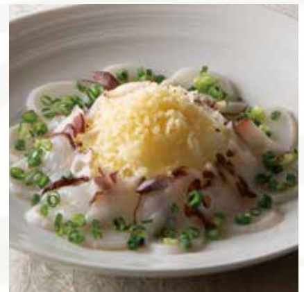
たこのポン酢かけ 1,200円