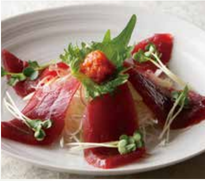
まぐろのたたき ポン酢かけ 1,500円