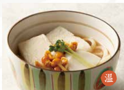
温 ちから 1,400円