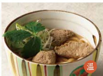
温 いわしのつみれ 1,400円