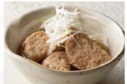
自家製 鶏のつくね煮 1,000円