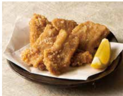
まぐろの竜田揚げ 1,200円