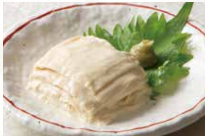
とろ湯葉のお刺身 1,250円