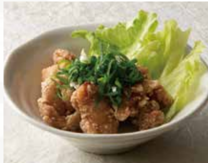
鶏の唐揚げ ポン酢仕立て 900円