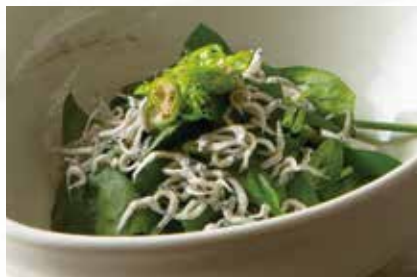
ほうれん草と辛味じゃこサラダ 1,100円