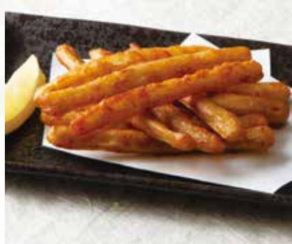
ごぼうの唐揚げ 900円