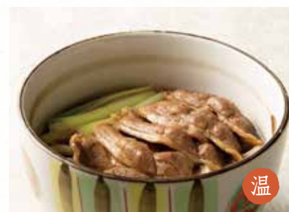
温 鴨南 1,850円